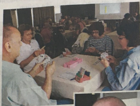
Na dnevih slovenskega bridgea je bil razglašen zmagovalec sezone 2021/22. Prvo mesto je med klubi osvojili Šaleški bridge klub s 1952 točkami. Sledita mu Ljubljanski BK s 1081 in BK Tivoli s 1049 točkami.

Tudi starostne omejitve ni, žal pa postaja igra starejših ljudi. Pri